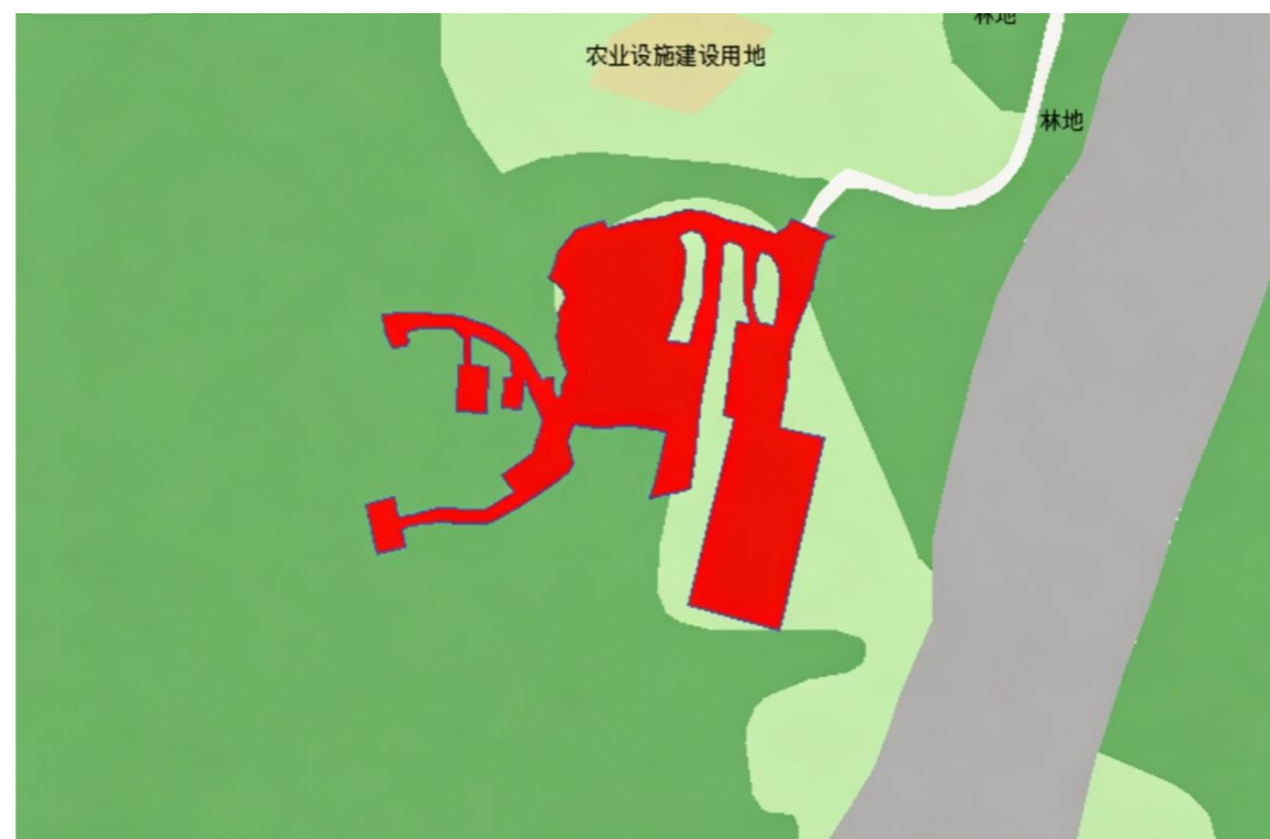
落实后土地使用规划图局部（SY01-SY08）