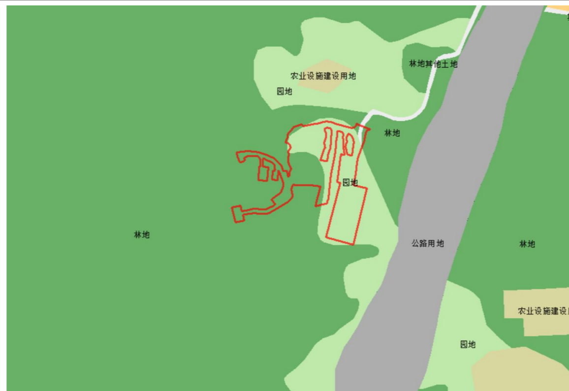
落实前土地使用规划图局部（SY01）

本项目符合《广东省自然资源厅关于做好城镇开发边界管理的通知（试行）》（粤自然资发〔2024〕4 号）、《广东省自然资源厅关于加强国土空间总体规划实施管理的通知》（粤自然资发〔2025〕2 号）、《清远市自然资源局转发广东省自然资源厅关于做好城镇开发边界管理的通知》（清自然资发〔2024〕18 号）等有关规定，现将《清远市清新区建设用地周转规模使用方案（太平镇丰盈民宿项目）》予以公示。