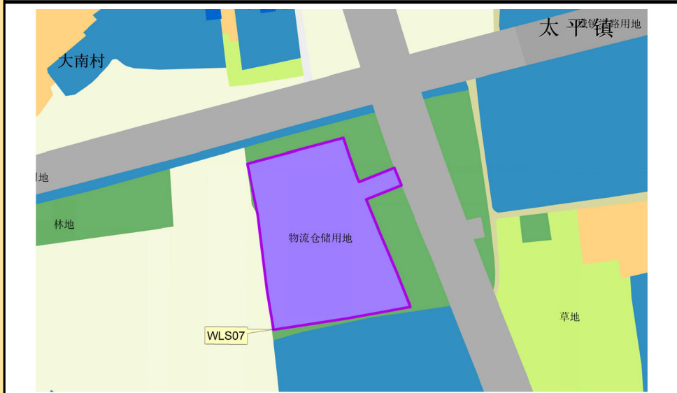
落实后土地使用规划图局部（WLS07）