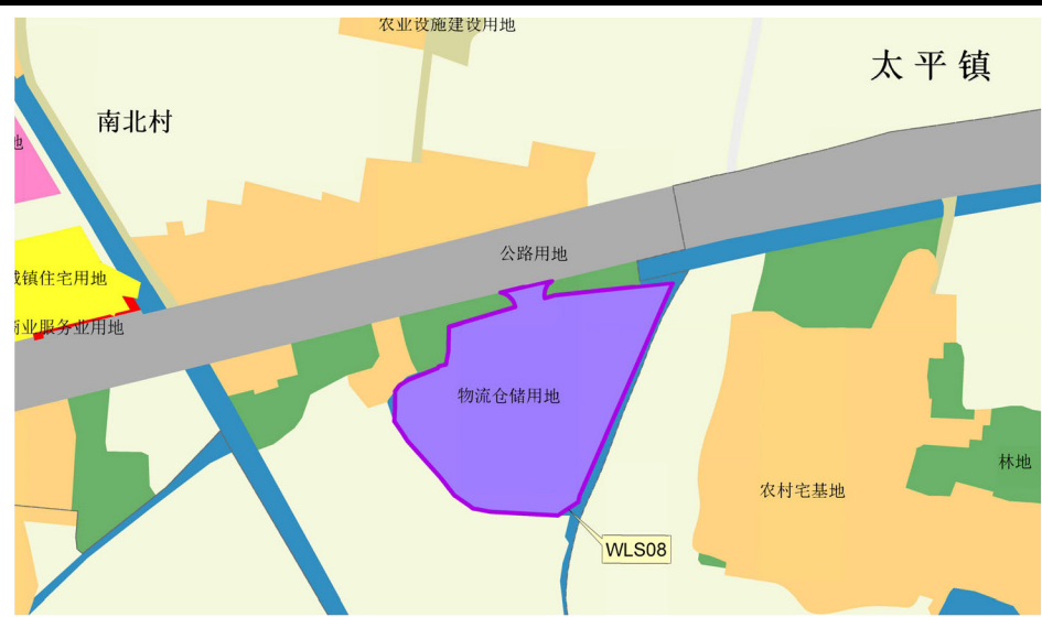
落实后土地使用规划图局部（WLS8）