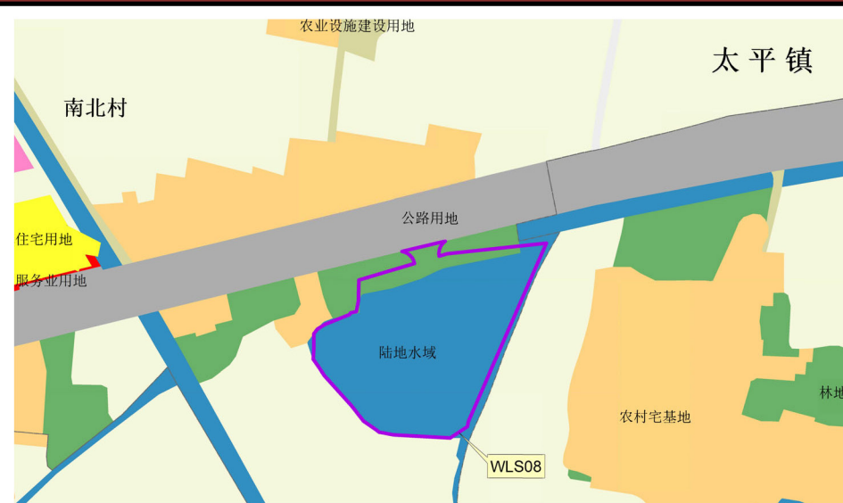
落实前土地使用规划图局部（WLS8）

本项目符合《广东省自然资源厅关于加强国土空间总体规划实施管理的通知》（粤自然资发〔2025〕2号）、《广东省自然资源厅关于做好城镇开发边界管理的通知（试行）》（粤自然资发〔2024〕4号）、《广东省自然资源厅关于规范城镇建设落地规模落实和建设落地规模使用报批材料的通知》（粤自然资规划〔2025〕1361号）等相关文件规定，现将《清远市清新区城镇建设落地规模落实方案（清新区秦岭基地农业度假项目等三个项目）》予以公示。