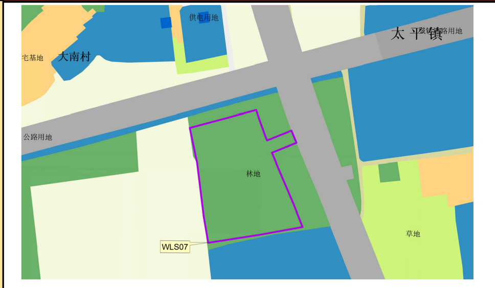
落实前土地使用规划图局部（WLS07）

本项目符合《广东省自然资源厅关于加强国土空间总体规划实施管理的通知》（粤自然资发〔2025〕2号）、《广东省自然资源厅关于做好城镇开发边界管理的通知（试行）》（粤自然资发〔2024〕4号）、《广东省自然资源厅关于规范城镇建设落地规模落实和建设落地规模使用报批材料的通知》（粤自然资规划〔2025〕1361号）等相关文件规定，现将《清远市清新区城镇建设落地规模落实方案（清新区秦岭基地农业度假项目等三个项目）》予以公示。